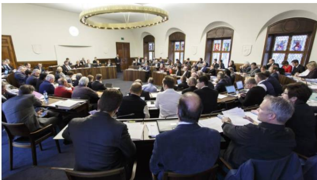
Kantonsrat in „normalen“ Zeiten