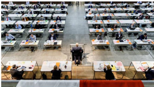
Kantonsrat SO im Corona-Jahr 2020

Ein Erfolg war der dringliche fraktionsübergreifende Auftrag «Zweiter Fernverkehrshalt in Grenchen», der im Kantonsrat einstimmig gutgeheissen wurde. In der Januar-Session 2021 sollte der Auftrag fraktionsübergreifend: «Schaffung einer Passage für den Fahrrad- und Personenverkehr zu Querung der SBB-Linie beim Bahnhof Grenchen Süd», behandelt werden. Die Vorstösse zeigen wie wichtig es ist, dass Grenchen auch in der neuen Legislatur im Kantonsrat vertreten ist.